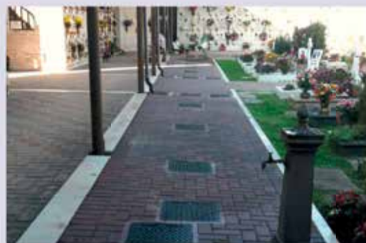
Cimitero Poggio Berni