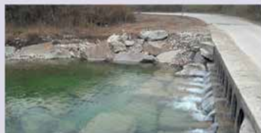
Guado sull'Uso a Trebbio