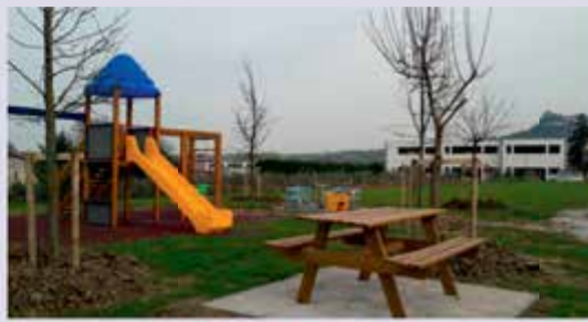
Parco giochi zona Colombari

Terzo polo sportivo è il campo da calcio situato nella zona artigianale di Camerano, dove in maniera