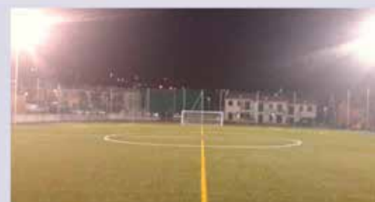
Impianto sportivo zona Colombare

Punto di riferimento per la frazione di Santo Marino e Poggio Berni è invece il centro sportivo comunale