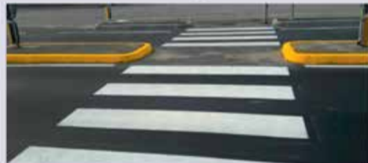
Attraversamento pedonale protetto, via Santarcangelo