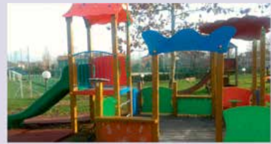
Gioco inclusivo al Centro Sportivo "G. Torrioni"

minore si sono resi necessari piccoli interventi di manutenzione. La struttura è utilizzata annualmente dall' Asd Settore Giovanile Poggio Berni e dal Virtus