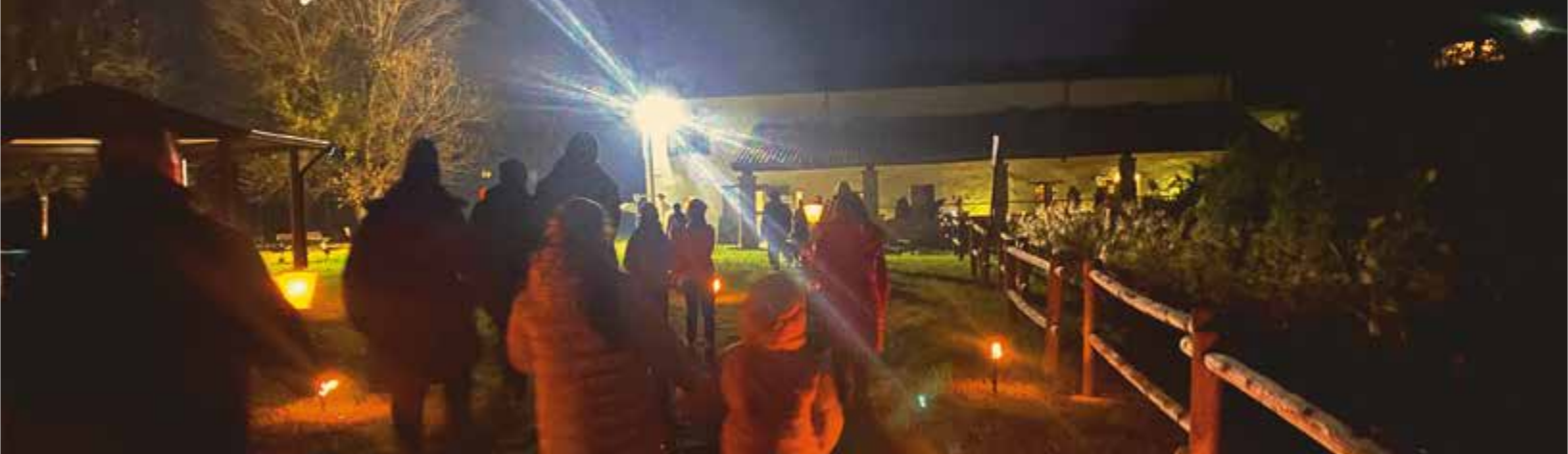
Foto di Repertorio: Fiaccolata al Mulino Sapignoli in occasione dell'inaugurazione del Presepe 2024